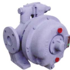
Version mit Heiz-/ Kühlmantel