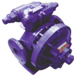
Doppelbypass für sicheren Schutz in beide Pumprichtungen