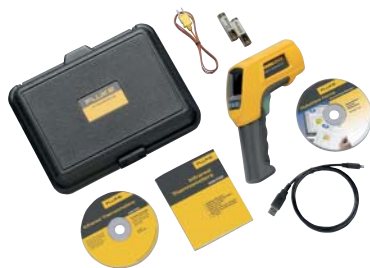
Fluke 568 und enthaltenes Zubehör